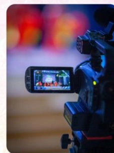
Фото и видеосъемка - в подарок за отзыв

Фирменная коллекционная наградная продукция